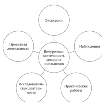
Рис. 5.3. Виды внеурочной деятельности по предмету «Окружающий мир»

21. Перечислите виды внеурочной деятельности по любому школьному предмету начальной школы. Задание может быть представлено в виде схемы.