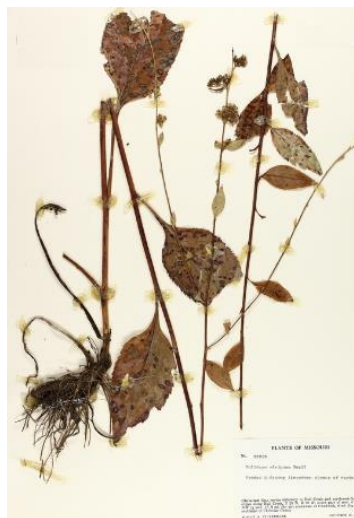
Рисунок 1 – Варианты правильного расположения растений на гербарном листе

Высушенные растения монтируются на гербарную бумагу формата А3 и закрываются листом кальки соответствующего формата. Растений приклеивают бумажными полосками клеем ПВА или пришивают нитками, закрепляя стежки с обратной стороны листа. На гербарный лист помещают растения одного вида. Высокие побеги перегибают под острым углом один – три раза, чтобы растение уместилось на одном листе (см. рисунок 1). Очень крупные экземпляры нужно разделить на части, при этом обязательно сделать срез корня с прикорневым листом, часть стебля со стеблевым листом, часть соцветия и разместить на нескольких листах.