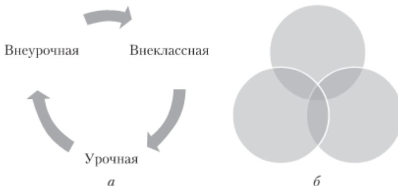
Рисунок – Схемы соподчинения разных форм организации учебной деятельности