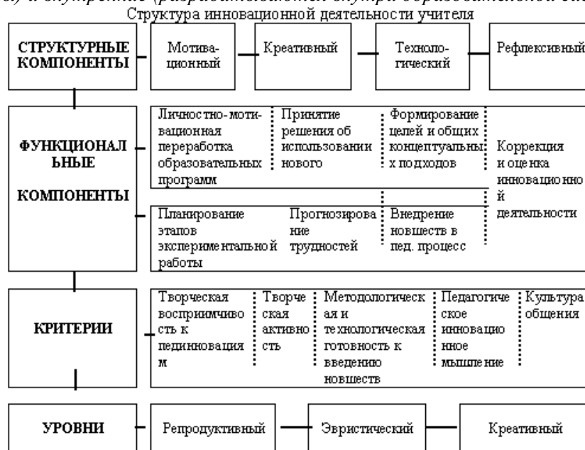
Схема 1. Структура инновационной деятельности учителя

Изменения в педагогической деятельности тесно связывают с инновациями . Педагогическая инновация или нововведение определяется как целенаправленное изменение , вносящее в образовательную среду стабильные элементы (новшества), улучшающие характеристики отдельных частей, компонентов и самой образовательной системы в целом. Педагогические инновации классифицируются по видам деятельности – педагогические, обеспечивающие педагогический процесс, управленческие, т.п.; по характеру вносимых изменений – радикальные (основанные на принципиально новых идеях и подходах), комбинаторские (новое сочетание известных элементов) и модифицирующие (совершенствующие и дополняющие существующие образцы и формы; по масштабу вносимых изменений – локальные (независимые друг от друга изменения отдельных участков или компонентов), модульные (взаимосвязанные группы нескольких локальных инноваций), системные (полная реконструкция системы как целого); по масштабу использования – единичные и диффузные; по источнику возникновения – внешние (за пределами образовательной системы) и внутренние (разрабатываются внутри образовательной системы).