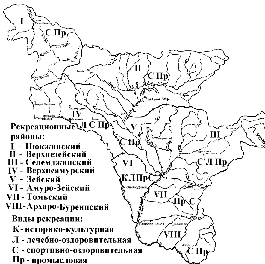
Рисунок 2 - Рекреационное районирование Амурской области

Составьте и обсудите план географической характеристики рекреационного района. Выполните картосхему