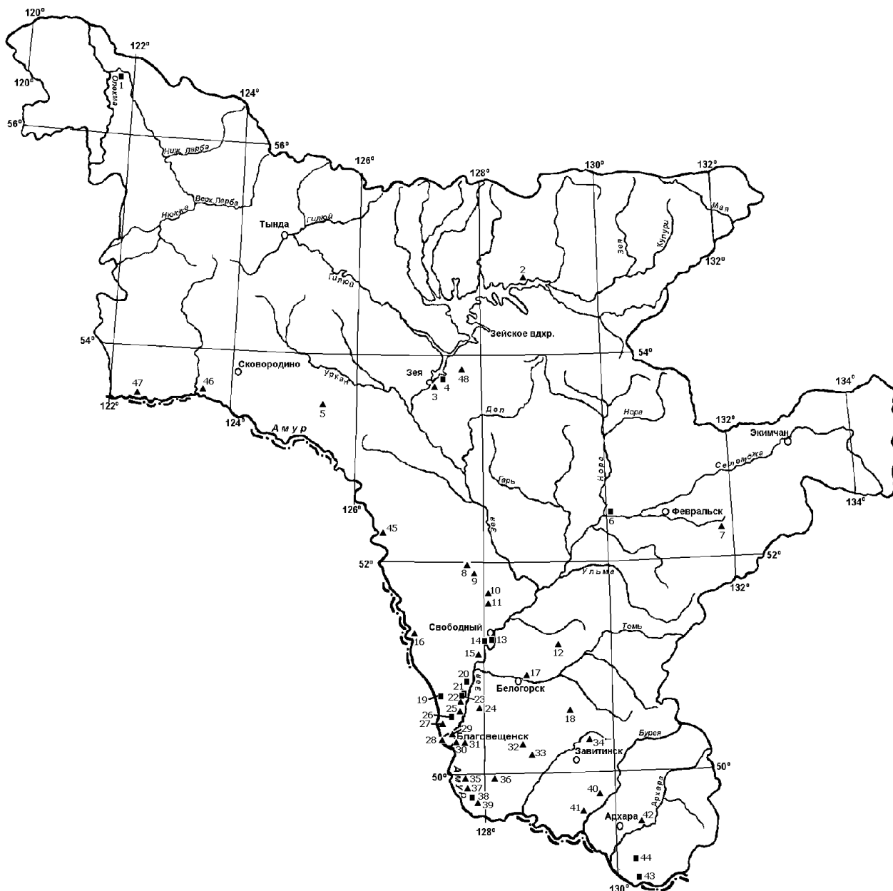
Рисунок 1: Туристские природные объекты и местности Амурской области