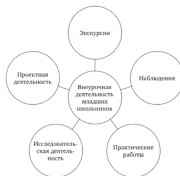
Рис. 5.3. Виды внеурочной деятельности по предмету «Окружающий мир»

22. Назовите массовые виды внеурочной работы.