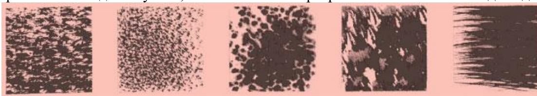
Изображение фактуры в технике акварельной живописи

Например, текстура дерева отличается от текстуры мрамора. В графическом рисунке характерные признаки материалов подчеркиваются с помощью различных технических средств изображения. Так, например, для изображения стекла применяют технику акварельной живописи и мягкой кисти для растительности — палочку, для бетона — сухую кисть и тушь или масляную краску. Кроме того, широко используются графические карандаши. Мягким карандашом хорошо передавать различную фактуру камня на зернистой (акварельной бумаге), более твердым, длинными штрихами на гладкой бумаге, можно показать прозрачность стекла или гладь воды.