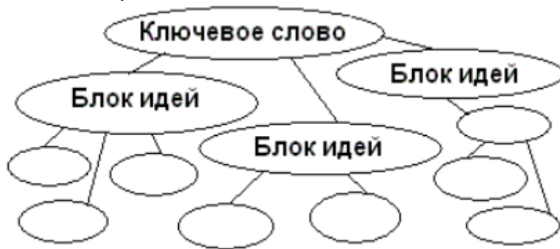
Рисунок 1. Представление кластера в виде «грозди» идей