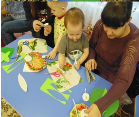
Совместное занятие по ручному труду (2 мл.гр.)