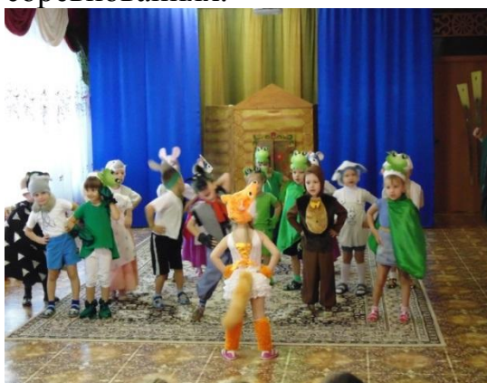
Родители шьют костюмы для детских постановок (ср.гр.)

Наше дошкольное учреждение предлагает родителям основные образовательные услуги и дополнительные в виде кружковой деятельности: кружок «Весёлые нотки», «Волшебная кисточка», «Юные театралы», «Самоделкин» и секции спортивного мяча «Школа мяча», где родители помогают нам оформлять зал к отчетным мероприятиям, шить костюмы для детей, оформлять выставки, готовить детей к участию в районных соревнованиях.