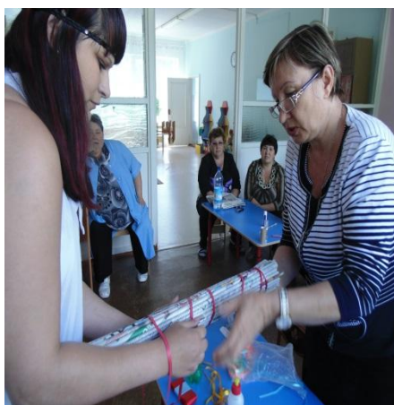
Семинар – практикум для педагогов, проводит родительница под.гр.

Наше дошкольное учреждение предлагает родителям основные образовательные услуги и дополнительные в виде кружковой деятельности: кружок «Весёлые нотки», «Волшебная кисточка», «Юные театралы», «Самоделкин» и секции спортивного мяча «Школа мяча», где родители помогают нам оформлять зал к отчетным мероприятиям, шить костюмы для детей, оформлять выставки, готовить детей к участию в районных соревнованиях.