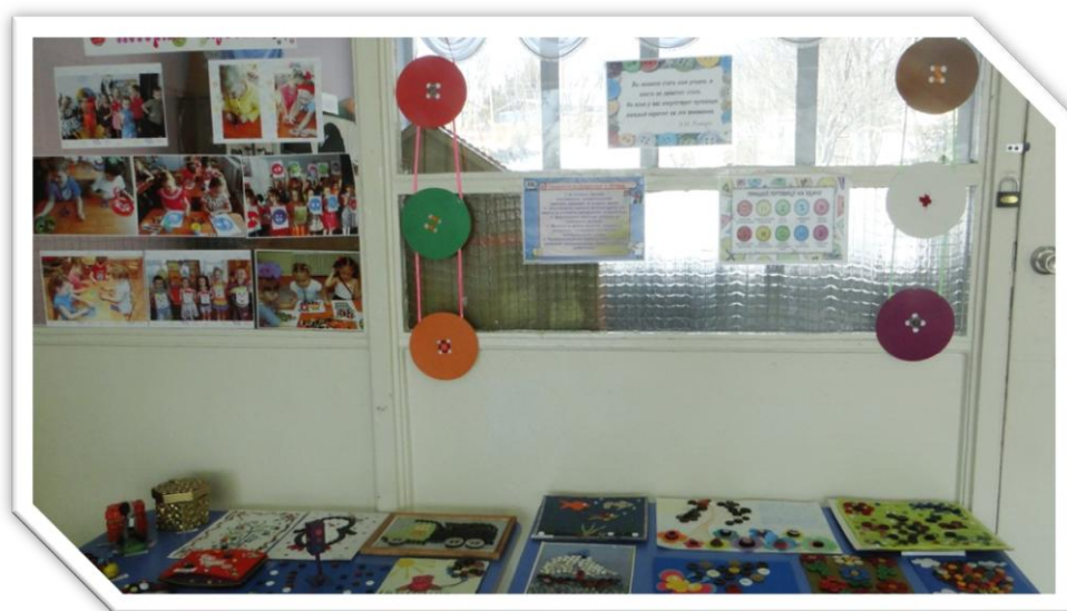
Работа по проекту «История пуговицы» (ст.гр.)