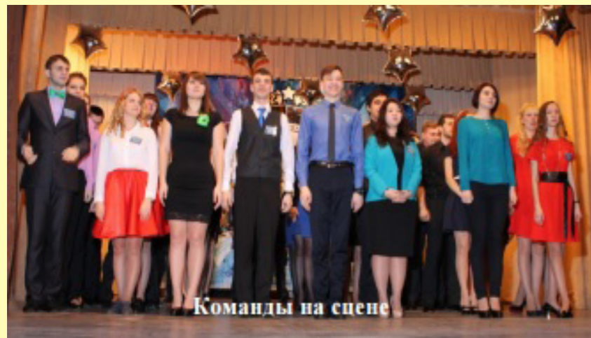
Команды на сцене