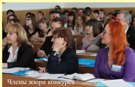
Члены жюри конкурса