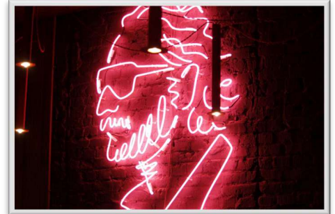
Ангелина Марьюшкина, 4 курс, ПиМНО